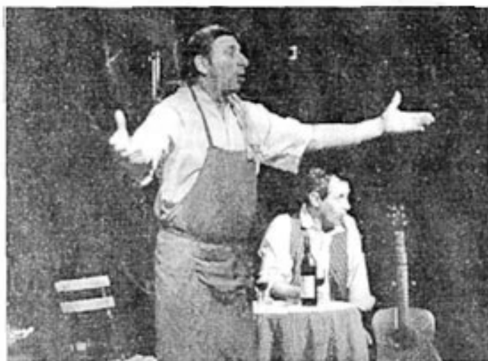
Deux spectateurs sur scène s'essayent à des nouveaux instruments.

■ Dans la salle, des tables parées de nappes de tissus aux couleurs chaleureuses, sur lesquelles des verres de dégustation s'apprentent à recevoir le vin du terroir. La scène, à peine un peu plus loin, initie parfaitement un bar à vin, dans lequel rien ne manque et surtout pas les barriques : le décor est planté.