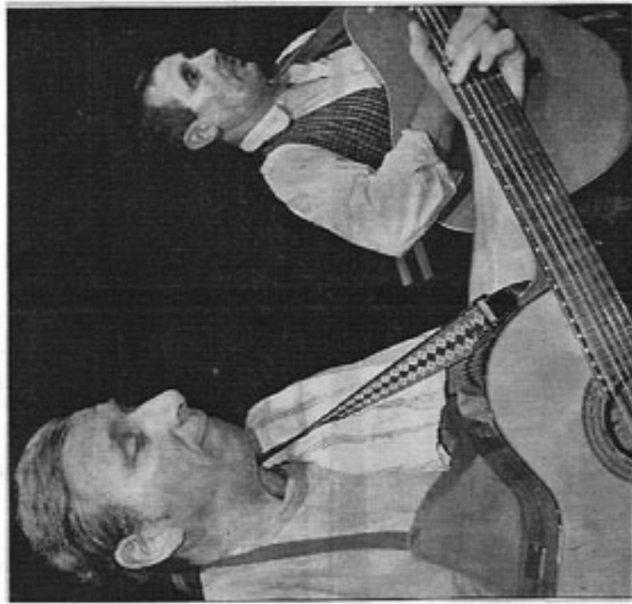
Un cabaret qui « chante le vin et enchante l'homme ».

Ouverture colorée et fruitée hier soir au centre des Ecraignes avec les trois coups de la 47e édition de la fête des Vendanges, une manifestation bien ancrée dans les traditions locales, conviviale et familiale à souhait, pour laquelle des milliers de visiteurs sont attendus au cours de ce week-end.